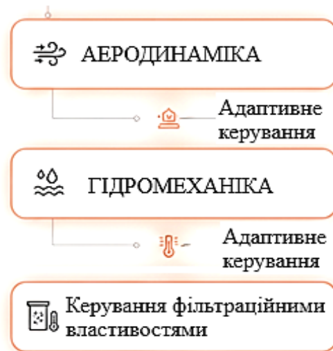
РИС. 1. Структура адаптивного керування вентиляційними потоками

підходів до керування станом геотехнічних систем. Ключовою умовою стабільності стає не просто контроль, а активне забезпечення стабільності аерогідромеханічних процесів у замкненому підземному просторі. Реалізація цієї мети можлива лише через впровадження методів адаптивного керування, які здатні гнучко підлаштовуватися під динамічні зміни навколишнього середовища (рис. 1)