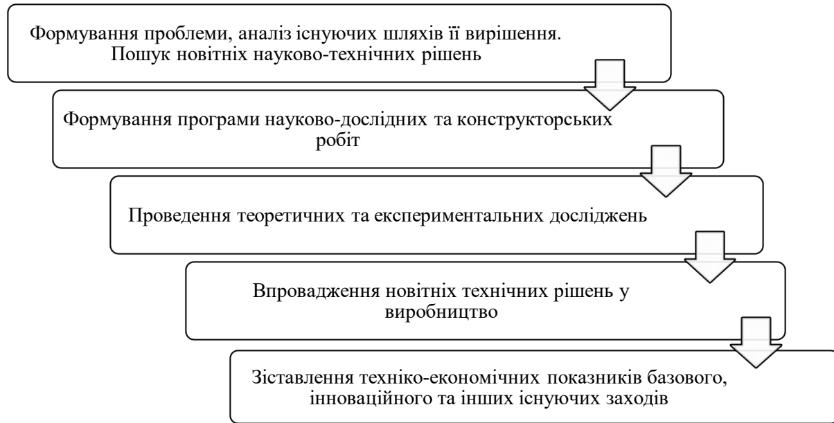
РИС. 2. Послідовність планування науково-дослідної діяльності